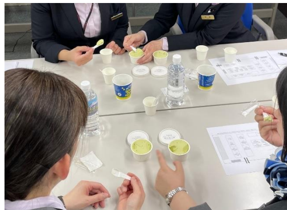
▲乳成分や、ずんだの配合違いを食べ比べ