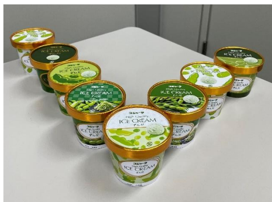
▲数種類のパッケージから1つを決定